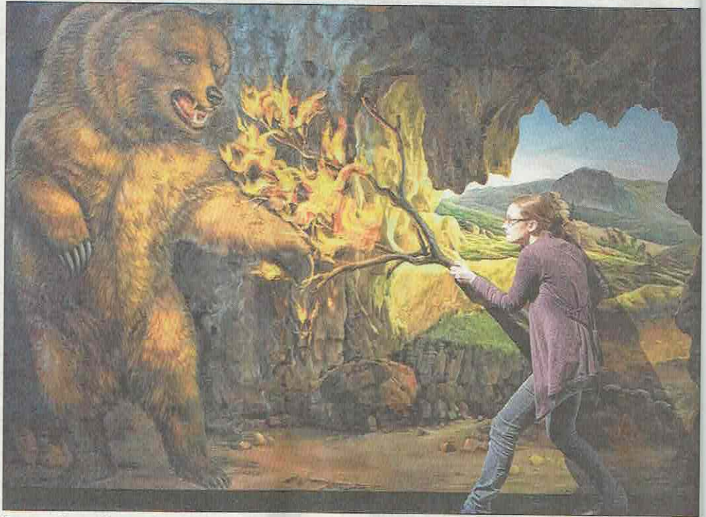
Fotografieren ist ausdrücklich erwünscht. Die Ausstellungsbilder entfalten ihre Wirkung erst richtig in der Interaktion mit den Besuchern.

Die dreidimensionale Wirkung entsteht nämlich erst durch das Spiel des Besuchers mit den Motiven. Ein Foto dieser Szene macht die Illusion perfekt. Mit Kreativität, Witz und Fantasie, aber dennoch völlig ungefährlich, darf der Besucher Dinosaurier füttern, sich gegen Höhlenbären wehren oder vor Wildschweinen flüchten und vieles mehr. Fast nebenbei lernt der Besucher mit viel Spaß Spannendes über die Naturgeschichte der eige-