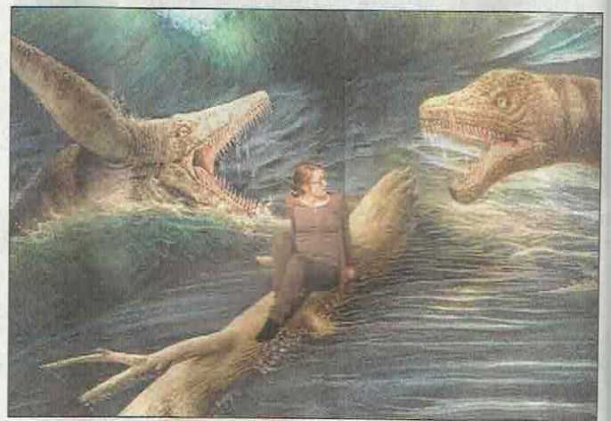
Wird die Besucherin von den Dinos verspeist?

Spaß an der Auseinandersetzung mit den 3D-Bildern das Interesse an der Naturgeschichte zu wecken oder zu verstärken.